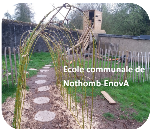
Ecole communale de Nothomb-Enova