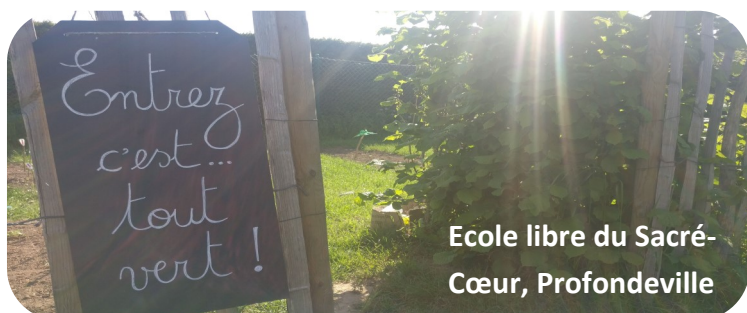
Ecole libre du Sacré-Cœur, Profondeville

Les 50 écoles sélectionnées recevront un accompagnement personnalisé de novembre 2021 à mai 2023 et une bourse entre 1000€ et 3500€.