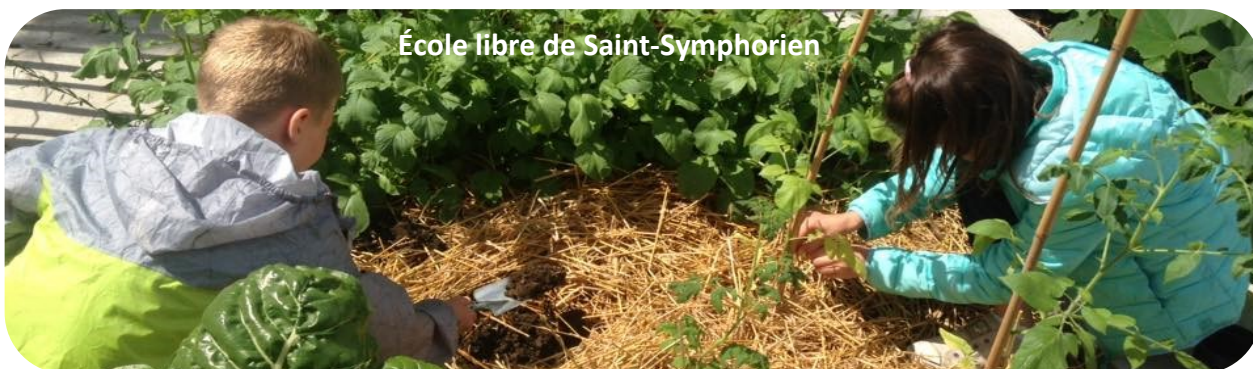
École libre de Saint-Symphorien

« Ose le vert, recrée ta cour », une campagne portée par GoodPlanet Belgium en partenariat avec Natagora et avec le soutien de la Wallonie.