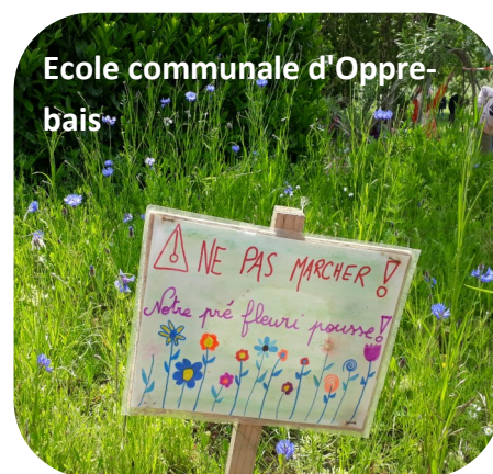
Ecole communale d'Opprebais

Pour toute information concernant la campagne :