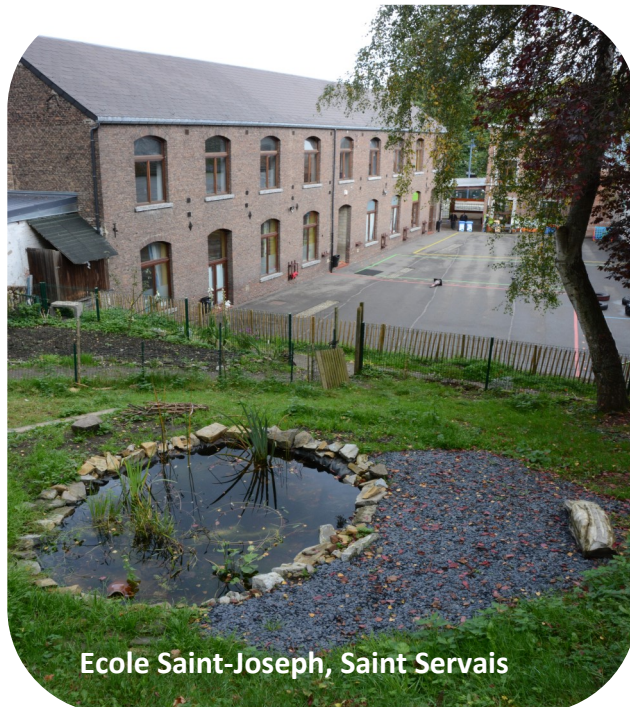
Ecole Saint-Joseph, Saint Servais