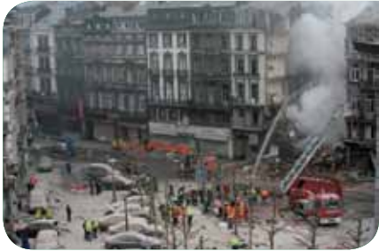
CATASTROPHE DE LA RUE LÉOPOLD À LIÈGE