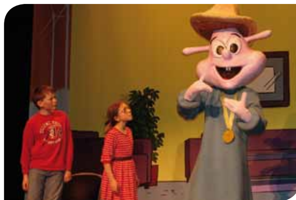
Energ'hic, mascotte de l'opération

Toutes deux ont remporté une journée d'animation aux "Vents d'Houyet", asbl spécialisée dans le développement de