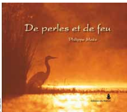
De perles et de feu aux Editions du Perron (172 pages / 166 photos en couleur / 14 récits)

DE PERLES ET DE FEU DE L'AUTEUR ET PHOTOGRAPHE NATURALISTE PHILIPPE MOËS